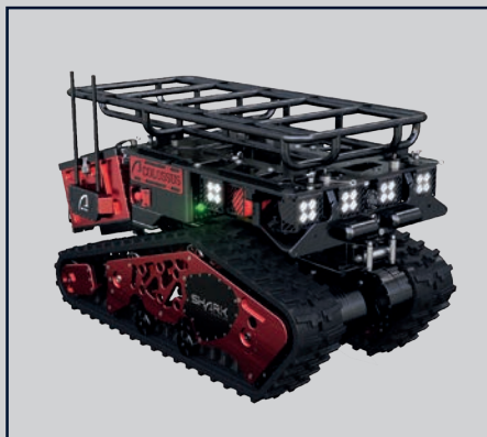
BAHRE FÜR VERWUNDETE