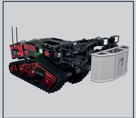
MOTORISIERTER BULL BAR