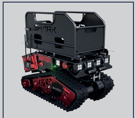
TRANSPORTKORB FÜR AUSTRÜSTUNG