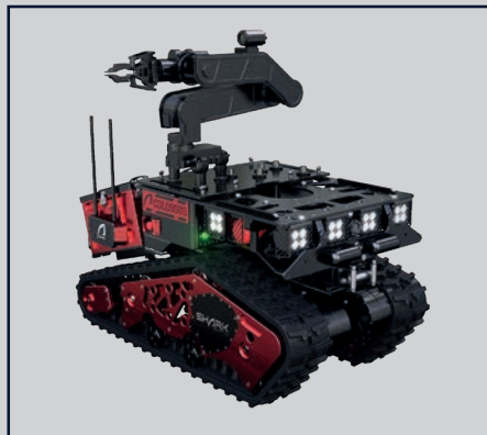
ARM (TRAGFÄHIGKEIT: 70 KG / 154 LBS)